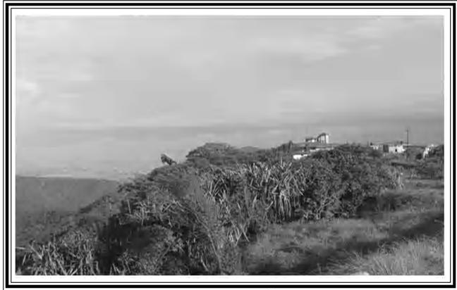
ଚେରାପୁଞ୍ଜି ସିଲଂଗର ସୌନ୍ଦର୍ଯ୍ୟ

ପ୍ରମୁଖ ହିଲ-ଷ୍ଟେସନ, ଉତ୍ତର ପୂର୍ବାଞ୍ଚଳରେ ରହିଛି । ଦେଶୀୟ ସଂସ୍କୃତି ଏବଂ ଖାଦ୍ୟ ଯୋଗୁଁ ଏ ଗୁଡିକର ପୁଣି ଏକ ସ୍ୱାତନ୍ତ୍ର୍ୟ ରହିଛି ଉତ୍ତର ପୂର୍ବାଞ୍ଚଳରେ ଗାଙ୍ଗଟକ୍ ହେଉଛି ଏକ ପ୍ରମୁଖ ପର୍ଯ୍ୟଟନ ସ୍ଥଳ । ବୌଦ୍ଧମଠ ପରିପୁର୍ଣ୍ଣ ଏହି ସହର ହେଉଛି ସିକ୍କିମ୍‌ର ସର୍ବବୃହତ୍ ସହର ଏବଂ ରାଜଧାନୀ । ଏହା ମଧ୍ୟ ପୂର୍ବ ସିକ୍କିମ୍ ଜିଲ୍ଲାର ମୁଖ୍ୟାଳୟ । ସେହିଭଳି ୨୦ ଏପ୍ରିଲ ୧୯୭୪ ମସିହାରୁ ଇଟାନଗର ଅରୁଣାଚଳ ପ୍ରଦେଶର ରାଜଧାନୀ ଭାବେ