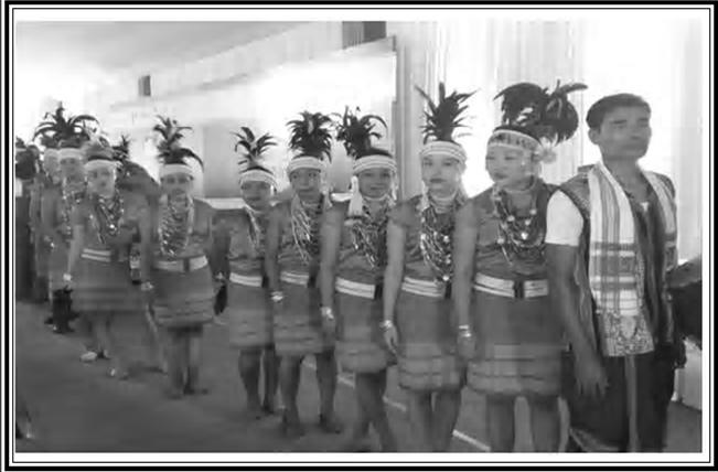
ଦେଶର ଉତ୍ତର ପୂର୍ବାଞ୍ଚଳ ସ୍ଥାନୀୟ ବାସିନ୍ଦାଙ୍କ ପାରମ୍ପରିକ ବେଷ ପୋଷାକ

ଦେଶର ଉତ୍ତର-ପୂର୍ବାଞ୍ଚଳ ପ୍ରକୃତିର ଆର୍ଶିବାଦ ଲାଭ କରିଛି ଏହା ସମଗ୍ର ବିଶ୍ୱର ଗୋଟିଏ ଉନ୍ନତ ଜୈବମଣ୍ଡଳ ର ମଧ୍ୟଭାଗରେ ଅବସ୍ଥିତ ରହିଛି । ଉତ୍ତର ପୂର୍ବାଞ୍ଚଳରେ ଜୈବ ବିବିଧତା ସହିତ ନାନା ପ୍ରକାରର ପଶୁପକ୍ଷୀ ଓ ବୃକ୍ଷଲତା ର ସମ୍ପର୍କ ଯୋଗୁଁ ଏଠାରେ ପର୍ଯ୍ୟଟନର ସମ୍ଭାବନା ଖୁବ୍ ଅଧିକ । ଏହି ଅଞ୍ଚଳ ଆଉ ମଧ୍ୟ ବିଭିନ୍ନ ଆର୍ଥିକ ସମ୍ଭଳରେ ଭରପୁର । ପର୍ଯ୍ୟଟନ ଦୃଷ୍ଟିରୁ ଏହି ଅଞ୍ଚଳର ସାଂସ୍କୃତିକ ଏବଂ ସଂପ୍ରଦାୟିକ ବିବିଧତା ଅନ୍ୟ ଏକ ଆକର୍ଷଣ । ଏଠାରେ ଥିବା ଜାତୀୟ ଉଦ୍ୟାନ ଏବଂ ବନ୍ୟପ୍ରାଣୀ ଅଭୟାରଣ୍ୟ ପ୍ରତି ବିଶ୍ୱର ବିଭିନ୍ନ ପ୍ରାନ୍ତର ପର୍ଯ୍ୟଟକ ଆକୃଷ୍ଟ ହୋଇଥାନ୍ତି । ଏତଦ୍ ବ୍ୟତୀତ ଚା ଚାଷ ଓ ଗ୍ରାମ୍ୟ ଜୀବନ ଆଦି ମଧ୍ୟ ପର୍ଯ୍ୟଟନ ପାଇଁ ବେଶ୍ ଖୋରାକ ଯୋଗାଇଥାନ୍ତି । ବିଭିନ୍ନ ଜାତି ଜନଜାତି ଏବଂ ଭାଷା ଭିତ୍ତିରେ ଏହି ଅଞ୍ଚଳକୁ ଆଠଟି ରାଜ୍ୟରେ ବିଭକ୍ତ କରାଯାଇଛି । ସେ ଗୁଡ଼ିକ ହେଉଛି ଆସାମ, ଅରୁଣାଚଳ ପ୍ରଦେଶ, ମେଘାଳୟ, ନାଗାଲାଣ୍ଡ, ମଣିପୁର, ମିଜୋରାମ, ତ୍ରିପୁରା ଏବଂ ସିକିମ୍ । ଦେଶର ଅନ୍ୟ ଅଞ୍ଚଳ ତୁଳନାରେ ଉତ୍ତର ପୂର୍ବାଞ୍ଚଳ ବିଭିନ୍ନ ଦୃଷ୍ଟିରୁ ଭିନ୍ନ । ଏହା ଏପରି ଏକ ଅଞ୍ଚଳ ଯେଉଁଠି ୧୦୦ରୁ ଊର୍ଦ୍ଧ୍ୱ ଭାଷା ଓ ଉପଭାଷା ଭାଷା ଆଦିବାସୀ ସଂପ୍ରଦାୟର ଲୋକ ବସବାସ କରନ୍ତି । କେବଳ ଅରୁଣାଚଳ ପ୍ରଦେଶରେ ୫୦ରୁ ଊର୍ଦ୍ଧ୍ୱ ଭାଷା ଉପଭାଷାର ପ୍ରଚଳନ ରହିଛି । ଏଠାକାର ଆଦିବାସୀଙ୍କ ସାମଞ୍ଜସ୍ୟ ରହିଛି ବର୍ମା ଆଇଲାଣ୍ଡ ଏବଂ ନାଗାଲାଣ୍ଡରେ ରହୁଥିବା ଆଦିବାସୀ ଙ୍କ ସହିତ । ସର୍ବୋପରି ଏହାର