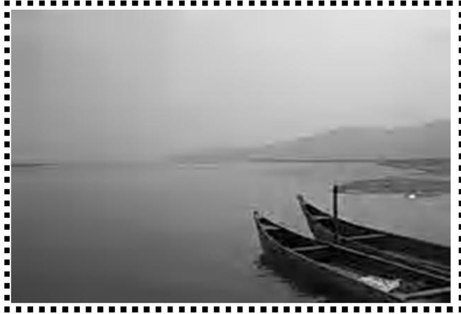
ଓଡ଼ିଶାର ବଡ଼ନଦୀ ମହାନଦୀ

ଏବେ କେନ୍ଦ୍ର ସରକାର ଦେଶରେ ବିଭିନ୍ନ ନଦୀ ସଂଯୋଗୀକରଣ ପାଇଁ ଗୁରୁତ୍ୱର ସହ ବିଚାର କରୁଛନ୍ତି । ସଂପ୍ରତି କେନ୍ଦ୍ର ଜଳ ସେଚନ ମନ୍ତ୍ରୀ ଉ ମ । ଭ । ର ତ 1 ଭୁବନେଶ୍ୱରରେ ଓଡ଼ିଶାର ମହାନଦୀ ଓ ଆନ୍ଧ୍ରର ଗୋଦାବରୀ ନଦୀ ମଧ୍ୟରେ ସଂଯୋଗୀକରଣ ପାଇଁ ଓଡ଼ିଶାକୁ ପ୍ରସ୍ତାବ ଦେଇଛନ୍ତି । ନଦୀ ସଂଯୋଗ ଦ୍ୱାରା ଜଳସେଚନ ବ୍ୟବସ୍ଥାରେ ଅଧିକ ଉନ୍ନତି ଆଣାଯାଇପାରିବ ବୋଲି କେନ୍ଦ୍ର ସରକାର ବିଚାର କରୁଛନ୍ତି ।