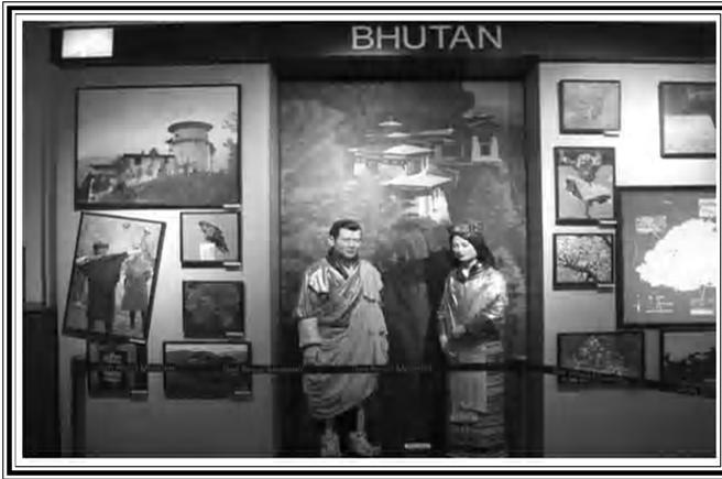
ଭୂଟାନର ସାଂସ୍କୃତିକ ଝଲକ ସମ୍ବଳିତ ସିଲଗ୍ରସ୍ଥିତ ତନ୍ ବସୋ ସ୍ୱଦେଶୀ ସଂସ୍କୃତି କେନ୍ଦ୍ର ପ୍ରଦର୍ଶନ କରାଯାଇଛି ।

କେନ୍ଦ୍ର ସରକାରଙ୍କ ପର୍ଯ୍ୟଟନ ମନ୍ତ୍ରାଳୟ ଅଧୀନ ଯୋଜନା ବ୍ୟୟର ୧୦ ପ୍ରତିଶତ କେବଳ ଉତ୍ତର-ପୂର୍ବୀଞ୍ଚଳ ରାଜ୍ୟଗୁଡ଼ିକ ପାଇଁ ଆରକ୍ଷିତ ରହିଛି । ଏଭଳି ଖର୍ଚ୍ଚର ଗତ ତିନିବର୍ଷର ବିବରଣୀ ନିମ୍ନରେ