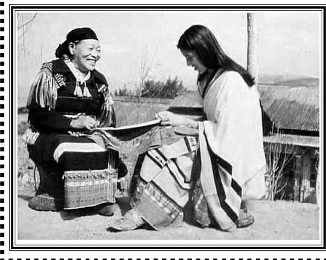
ଯୋଜନା, ଅପ୍ରେଲ ୨୦୧୬

ଥିବା ସ୍ୱତନ୍ତ୍ର ବ୍ୟବସ୍ଥାକୁ ଉଠାଇଦେଲା । ମିଜୋରାମରେ ଷଷ୍ଠ ଅନୁଚ୍ଛେଦ କେବଳ ନିଜ ରାଜ୍ୟ ମଧ୍ୟରେ ଥିବା ସଂଖ୍ୟାଲଘୁ ଜନଜାତିଙ୍କ ପାଇଁ ଲାଗୁ ହେବ ବୋଲି ନିଷ୍ପତ୍ତି ନେଲା । ତେବେ ମେଘାଳୟ ଷଷ୍ଠ ଅନୁଚ୍ଛେଦ ନୀତିରେ ସଂଖ୍ୟାଲଘୁ ଜନଜାତିଙ୍କ ପାଇଁ ସ୍ୱୟଂଶାସିତ ଜିଲା ପରିଷଦ (ଏଡିସି) ବ୍ୟବସ୍ଥା ରଖି ଯେଉଁ ବର୍ଗର ଜନପ୍ରତିନିଧି ରାଜ୍ୟ ବିଧାନସଭାକୁ ନିର୍ବାଚିତ ହୋଇପାରୁନଥିଲେ ସେହି ବର୍ଗଙ୍କ ପାଇଁ ଏକ ନୂଆ ରାଜନୈତିକ ଅନୁଷ୍ଠାନର ବ୍ୟବସ୍ଥା କଲା । ଏହା ବିଧାନସଭାର ଏକ ଅଧିକ ସଭାଭାବେ କାର୍ଯ୍ୟ କଲା । ମେଘାଳୟ ଆସାମର ଅଂଶ ବିଶେଷ ଥିବାବେଳେ ଏହିସବୁ ସ୍ୱୟଂଶାସିତ ପରିଷଦଗୁଡ଼ିକ ସକ୍ରିୟ ଥିଲେ । ଅଣ ଆଦିବାସୀ ବହୁଳ ରାଜ୍ୟ ଶାସନ ବ୍ୟବସ୍ଥାରେ ଏହି ସଂଖ୍ୟାଲଘୁ ଆଦିବାସୀଙ୍କୁ ଏକ ପ୍ରକାର ସ୍ୱୟଂଶାସନର ଅଧିକାର ଦିଆଯାଇଥିଲା । ଏବେ ମେଘାଳୟ ଏକ ସ୍ୱୟଂସମ୍ପୂର୍ଣ୍ଣ ରାଜ୍ୟରେ ପରିଣତ ହୋଇଥିବାରୁ ଏବଂ ଏଠାରେ ମୋଟ ଜନସଂଖ୍ୟାର ୮୫ ଶତାଂଶ ଆଦିବାସୀ ହୋଇଥିବା ଦୃଷ୍ଟିରୁ ଏଭଳି ସ୍ୱୟଂଶାସନ ପରିଷଦର କୌଣସି ଯଥାର୍ଥତା ନାହିଁ । ତଥାପି ମେଘାଳୟରେ ସେହି ବ୍ୟବସ୍ଥା ଚାଲୁ ରହିଛି ।