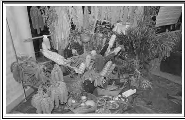
ଗ୍ରାମୀଣଙ୍କ ଦ୍ୱାରା ଉତ୍ପାଦିତ ସ୍ୱଦେଶୀ କିଷମର ଶସ୍ୟ ସାଂସ୍କୃତିକ ଆକର୍ଷଣ

କୁହାଯାଏ । ଏଠିକାର ବିଶେଷ ପର୍ଯ୍ୟଟନ - ଆକର୍ଷଣ କେନ୍ଦ୍ରଗୁଡ଼ିକ ହେଉଛି ଡନ ବସ୍ତୋ ସଂଗ୍ରହାଳୟ, ବଚରଫୁଲ ସଂଗ୍ରହାଳୟ, ବୋଟାନିକାଲ ଗାର୍ଡେନ, ସିଂଲର୍ ଶିଖର ଏବଂ ଓଡ଼ିସ୍ ହ୍ରଦ ।